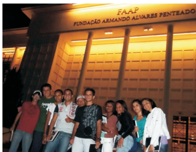
Alunos do Curso Técnico em Marketing em evento na FAAP - Ribeirão Preto para palestra sobre pesquisa de mercado.