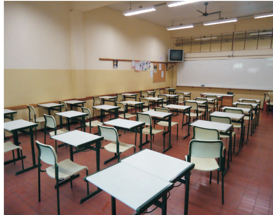
Sala de aula com pintura nova para o início do ano letivo 2011.

É importante, principalmente ao aluno, que utiliza a estrutura da escola diariamente, conhecer a APM e seu trabalho intenso na gestão de recursos para que a escola tenha sempre um ambiente que promova o aprendizado.