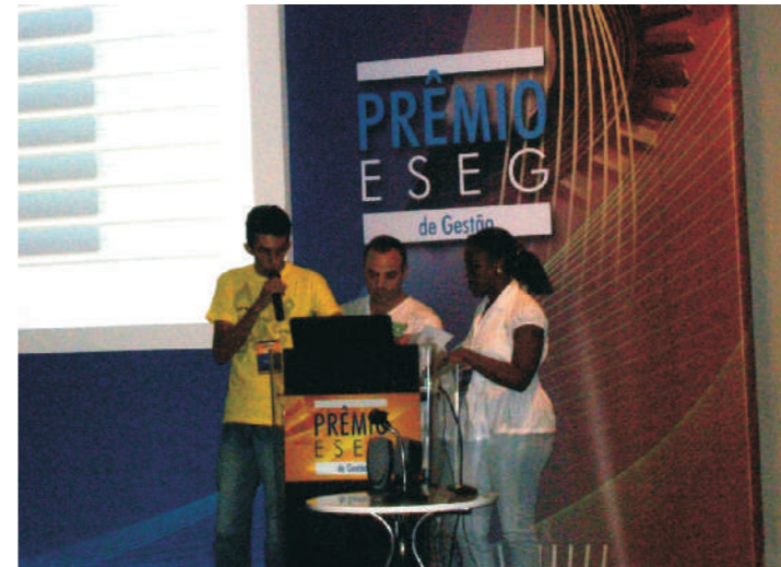
Os alunos durante a apresentação do prêmio em São Paulo nos dias 03 e 04 de Dezembro de 2010.

As inscrições para o Prêmio ESEG 2011 já estão abertas. Mais informações sobre o prêmio podem ser acessadas no site da ESEG cujo link está disponível na página da Etec Pedro Badran.