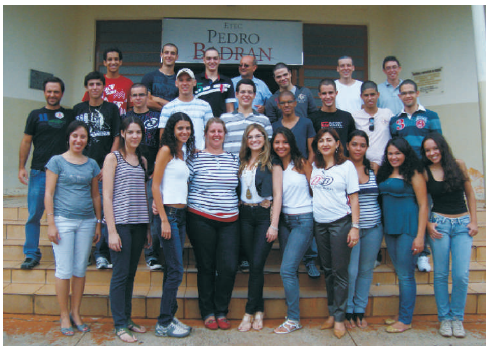
Professores do Ensino Médio e alguns dos alunos aprovados, reunidos antes do bate papo com os atuais estudantes para troca de experiências.

Cada ano que passa o número de alunos que são aprovados nas melhores faculdades do país aumenta e a credibilidade do ensino médio da ETEC Pedro Badran acompanha esse efeito. ■