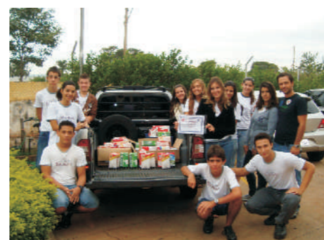
Entrega do leite para representantes da AVCC Associação dos voluntários de Combate ao Câncer.

Como resultado do "Trote Solidário" foram arrecadados 120 litros de leite, 77 frascos de detergente e 83 pacotes de sabonete. O leite foi doado para o Hospital do Câncer de Barretos. Os detergentes e sabonetes foram entregues para o Asilo Municipal de São Joaquim da Barra, local onde os alunos dos primeiros ensino médio, fizeram a entrega e aproveitaram para receber e doar "calor humano" aos idosos. Cantaram e se relacionaram com os moradores do asilo. ■